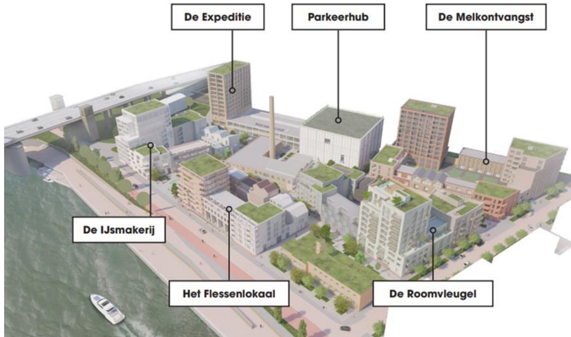
Figuur 2 (dit is een schets, de situatie kan nog wijzigen)

Aan de Rijn in Arnhem heeft BPD Ontwikkeling B.V. ('BPD') het project Cobercokwartier ontwikkeld. Cobercokwartier bestaat uit verschillende fases. Deze notitie betreft Blok B – de Melkontvangst.