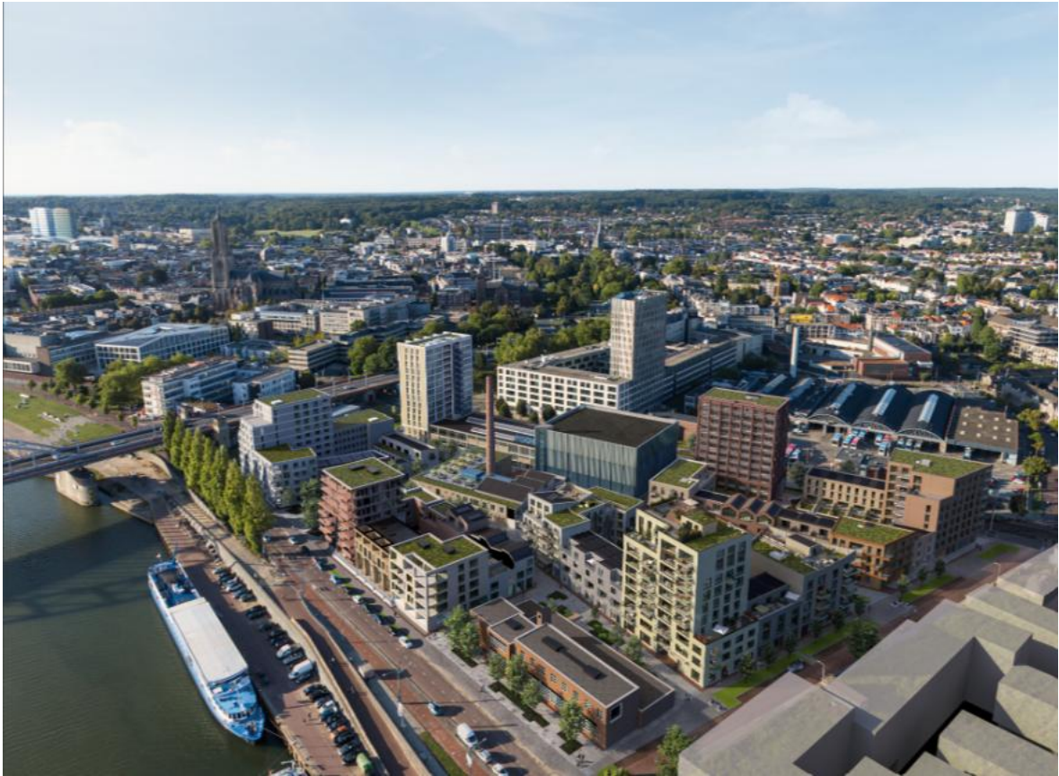
Figuur 1 (dit is een impressie, de situatie kan nog wijzigen)

Aan de Rijn in Arnhem heeft BPD Ontwikkeling B.V. ('BPD') het project Cobercokwartier ontwikkeld. Cobercokwartier bestaat uit verschillende fases. Deze notitie betreft Blok D – de Roomvleugel.