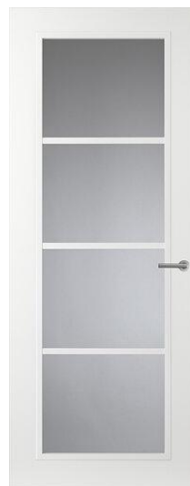
Design CN07 Binnendeur met Glas