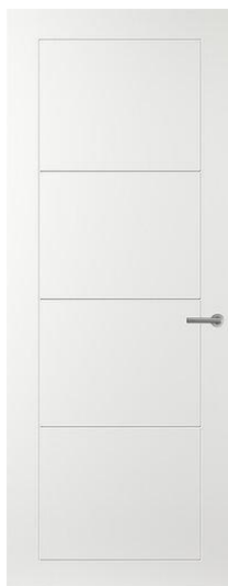
Connect CN55 Lijndeur