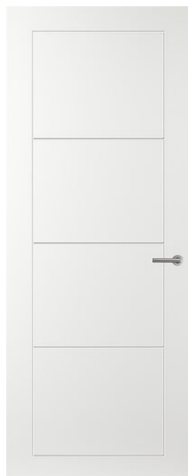
Connect CN55 Lijndeur