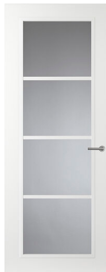
Design CN07 Binnendeur met Glas