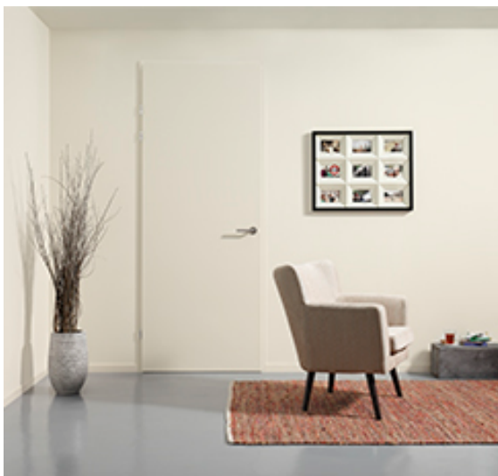
Opdekdeur zonder bovenlicht